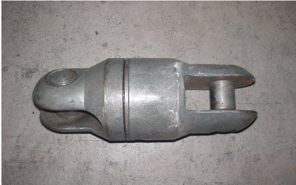
割ワイヤ用スィーベル