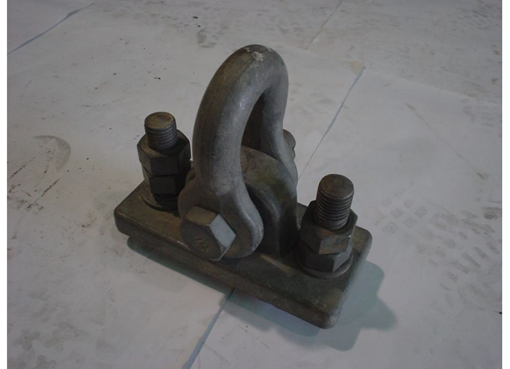
延線釣車取付金具(BD)……T型