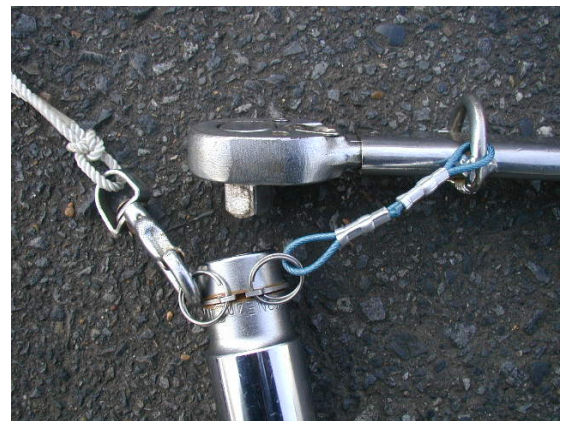
ソケット交換時・状態

2重リングをC型止め輪に取付けることで、交換時には片方の2重リングからステンレスワイヤーを外し、落下防止用ロープを付けて対応することでソケットがフリー状態になり、落下を阻止出来るようにしました。