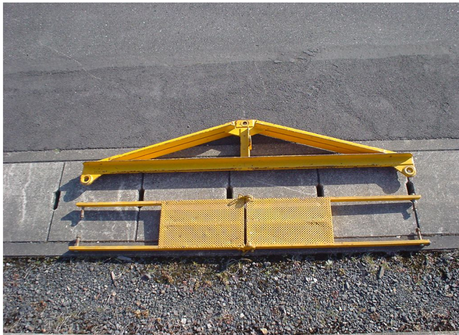
重角度用2連金車吊金具